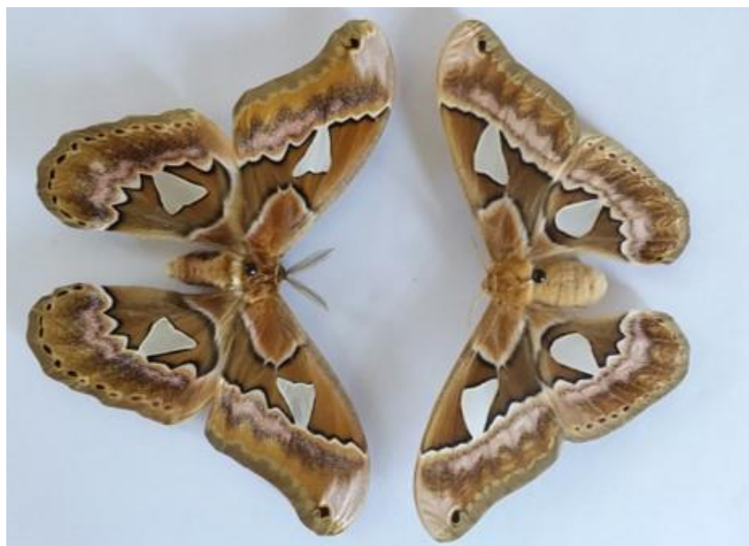
Figura 3. Insectos adultos de R. orizaba (izquierda macho y derecha hembra).

alta presencia de cultivos gramíneos, no presenta una alta alteración del ecosistema, permitiendo el desarrollo de esta especie.