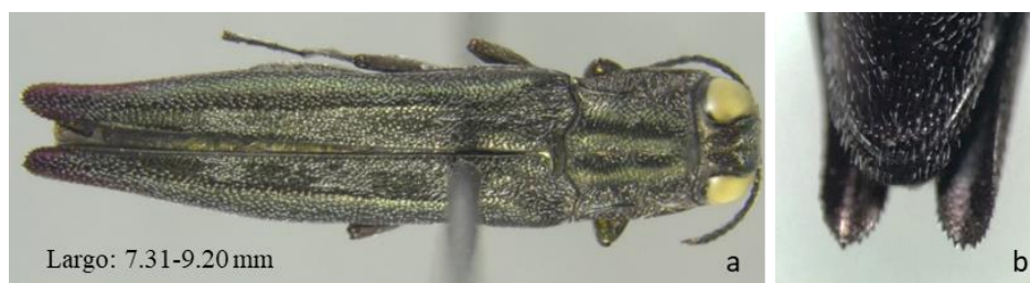
Figura 1. Agrilus sparsus Waterhouse, 1889: a) vista dorsal; b) ápice del último esternito abdominal

Para los géneros Anthaxia , Agrilus , Paragrillus , Omochyseus , Taphrocerus y Leiopleura sólo se tomaron en cuenta las características del clípeo, vértex, frente, antenas, pronoto, escutelo, élitros, proesterno, mesoesterno, metaesterno, metaepipleura, coxas, fémures, tibias, tarsos y abdomen, ya que el labro y las mandíbulas eran difíciles de apreciar en el microscopio por ser ejemplares demasiado pequeños.