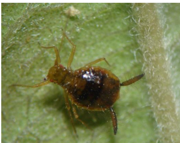
Figura 1. Áfido áptero de Greenidea psidii .

Durante la recolecta de áfidos en los municipios de Tabasco y Villanueva se confirmó la presencia de G. psidii . De acuerdo con Halbert (2004) el adulto áptero (Fig. 1) tiene forma de pera y en la base del sifúnculo se observan reticulaciones (Fig. 2).