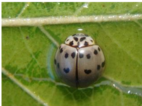
Figura 4. Adulto de Olla v-nigrum .