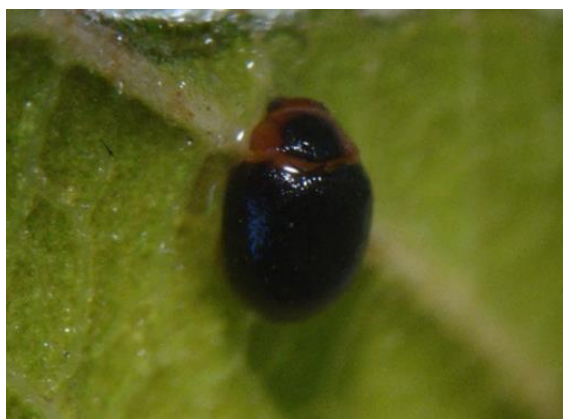
Figura 6. Adulto Scymnus sp.