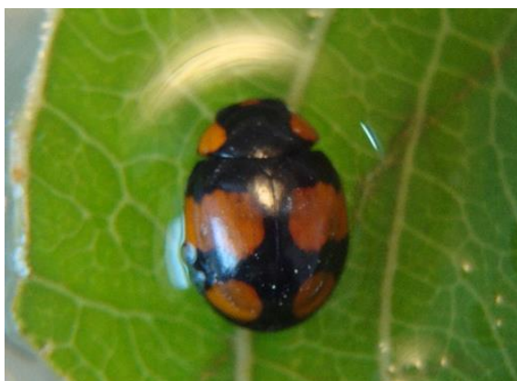
Figura 5. Adulto de Brachiacantha decora .