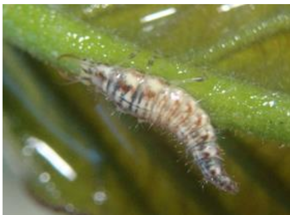
Figura 3. Larva de Chrysoperla carnea .

Los enemigos naturales colectados fueron: larvas de Ch. carnea de Chrysopidae, y adultos de las catarinitas Olla v-nigrum (Mulsant, 1866), Brachiacantha decora (Casey 1899), y Scymnus sp. (Kugelann 1794), figuras 3, 4, 5 y 6 respectivamente.